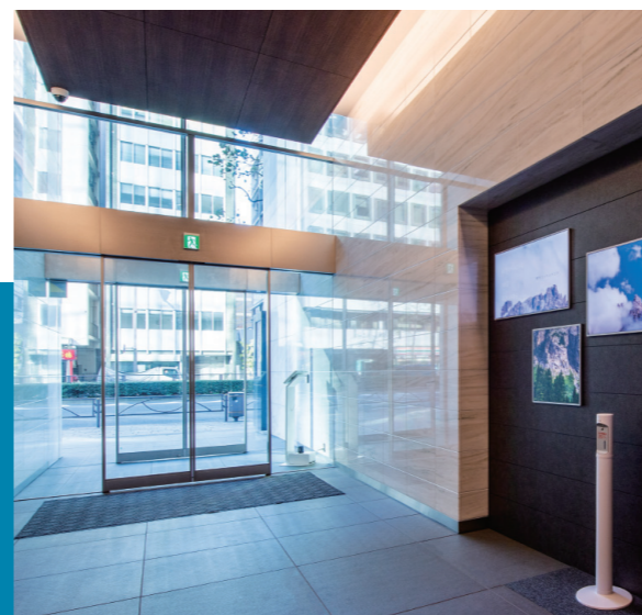
1F エントランス/セキュリティ自動ドアを新設

1階エントランスホール。仕上げ材の検討の際はメーカーのショールームに足を運びサンプルを複数用意し一つひとつ納得のいくまで検討を重ねた