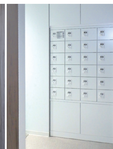
トイレの小物入れを新設