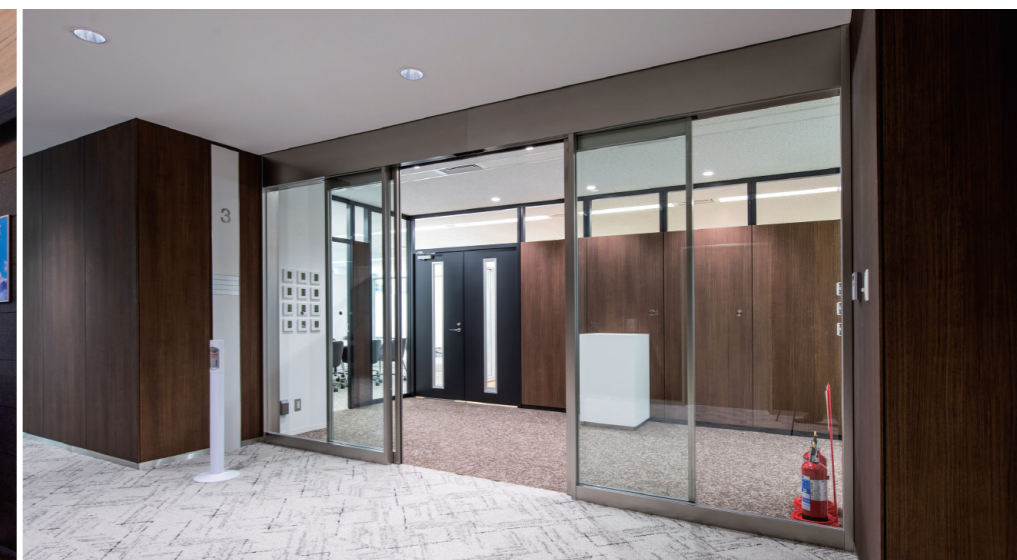
EV更新に伴い、カードリーダーによる不停止階の設置に加え、各専有部入り口にセキュリティ自動ドアを新設し、セキュリティを強化