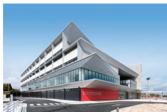
愛知県警察運転免許試験場 愛知県