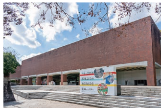
山口県立美術館 山口県