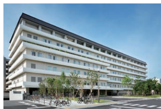
京都市立病院 京都府