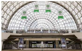
大阪国際見本市会場 / インテックス大阪 大阪府