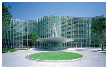
国立新美術館 東京都